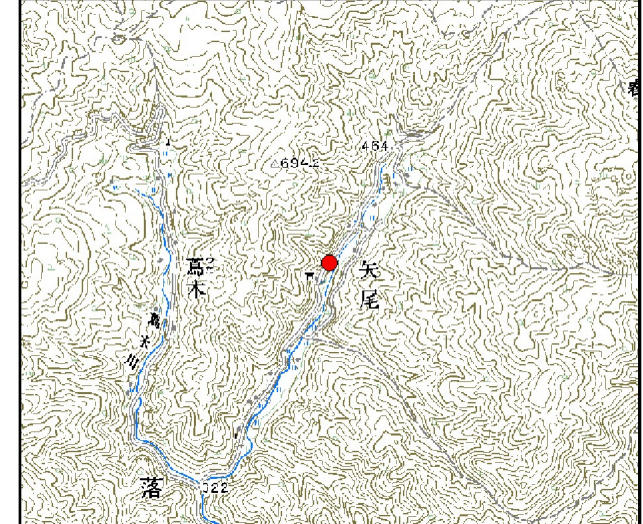
位置図* 縮尺: 1/50,000