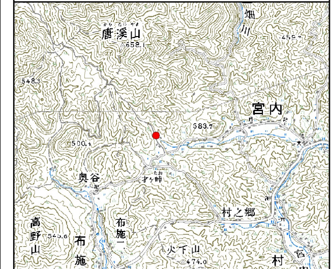
位置図※ 縮尺: 1/50,000