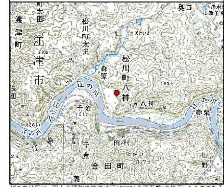
位置図* 縮尺: 1/50,000