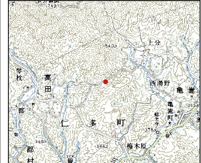
位置図※ 縮尺: 1/50,000