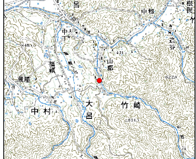
位置図※ 縮尺: 1/50,000