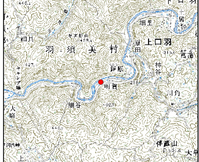
位置図※ 縮尺: 1/50,000