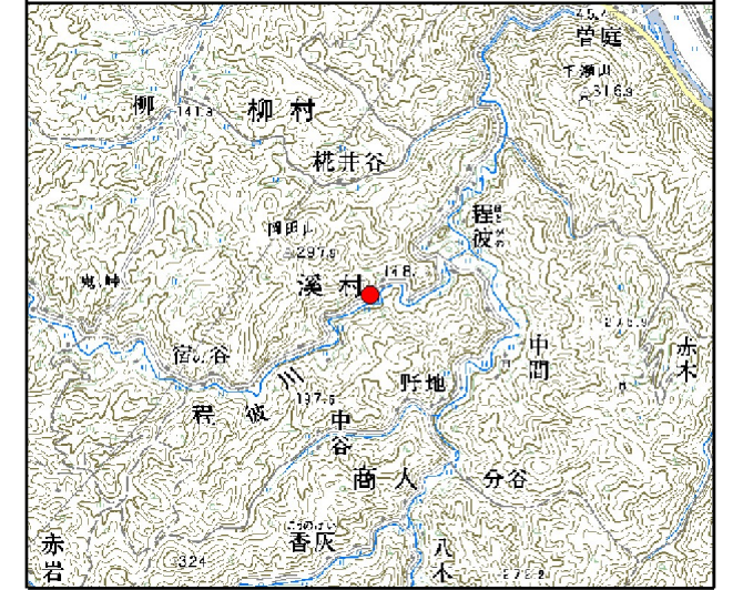
※この地図は、国土地理院の数値地図50000(地図画像)を使用したものである。