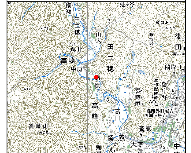
位置図 ※ 縮尺: 1/50,000