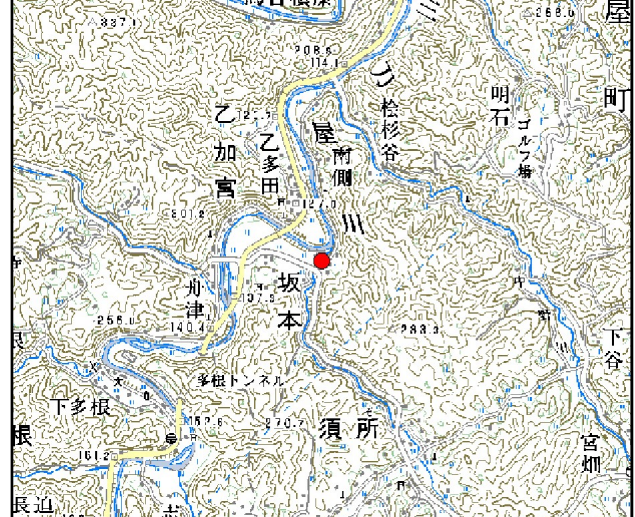
位置図※ 縮尺: 1/50,000