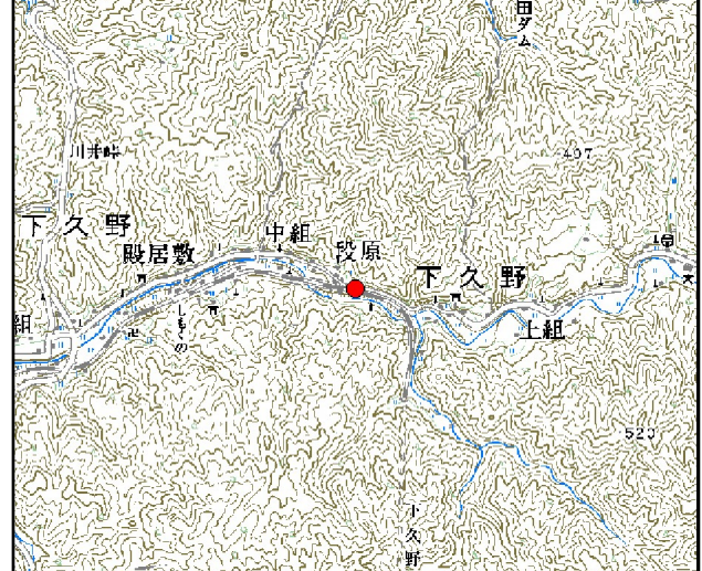
位置図※ 縮尺: 1/50,000