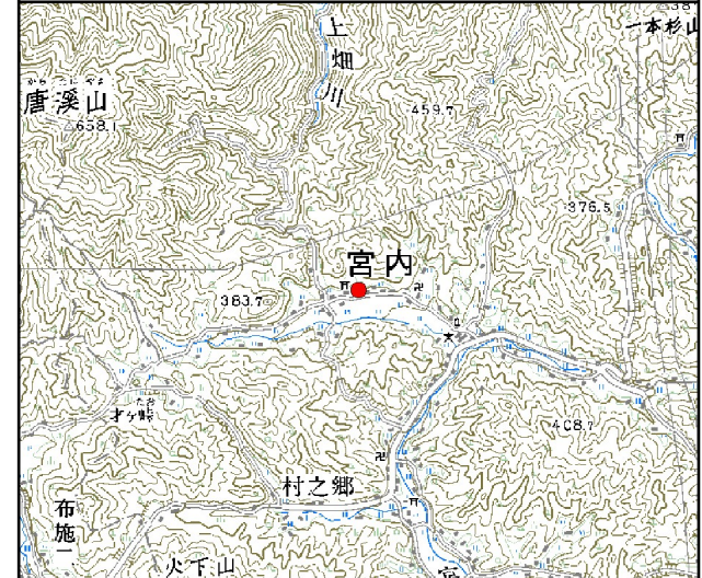
位置図※ 縮尺: 1/50,000