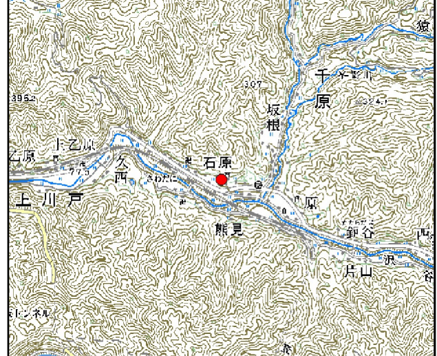
位置図※ 縮尺: 1/50,000