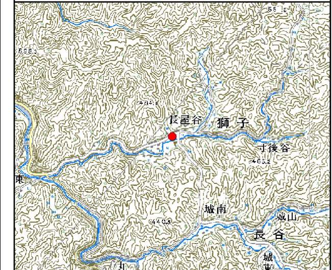
位置図※ 縮尺: 1/50,000