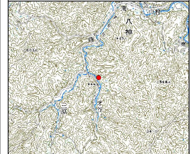
位置図※ 縮尺: 1/50,000