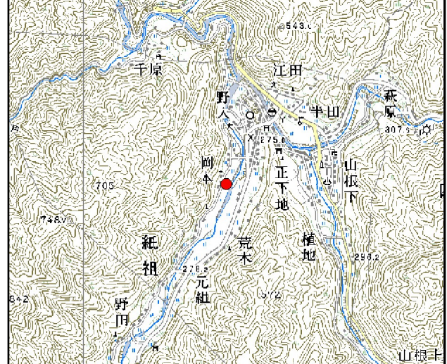
位置図※ 縮尺: 1/50,000