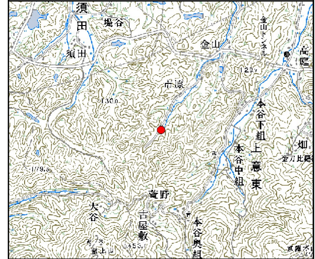
位置図※ 縮尺: 1/50,000