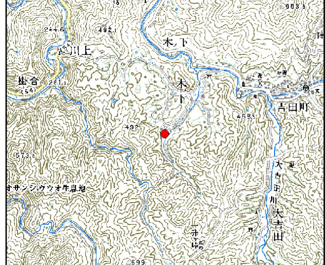
位置図※ 縮尺: 1/50,000