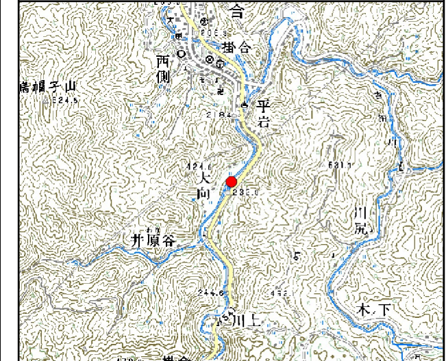
位置図※ 縮尺: 1/50,000