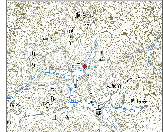
位置図※ 縮尺: 1/50,000